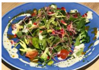
有機野菜サラダ (黒酢ドレッシング オニオン or 柚子塩) ¥800(税抜)