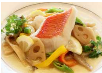
金目鯛の黒酢餡かけ