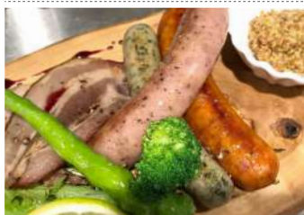
黒酢もろみベーコン & 低添加ソーセージ ¥1,400(税抜)