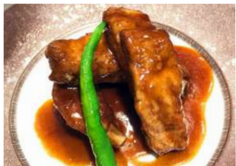
スペアリブの黒酢酢豚 ¥1,800(税抜)