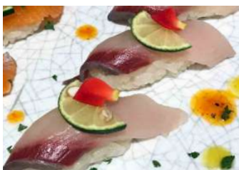
黒酢もろみブリ寿司