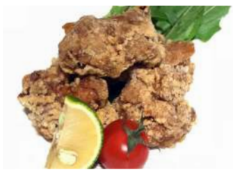
食べる黒酢の唐揚げ