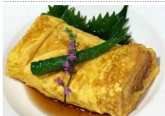
鰹黒酢の卵焼き (枕崎産鰹節使用) ¥500(税抜)

※お肉・お魚など食べやすい大きさにカットいたします。ご遠慮なくお申し付けください。 ※食物アレルギーのある方は、スタッフまでお気軽にご相談ください。当店では、調理器具および食器の洗浄をしておりますが、本来その商品に含まれていない他のアレルギー物質が意図せず混入してしまう場合がございますので、ご注意ください。