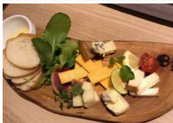
チーズの盛り合わせ ¥1,000(税抜)