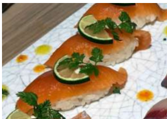
霧島サーモン寿司